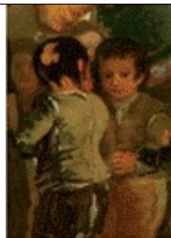
Pintura 4 Título: La boda Autor: Francisco de Goya y Lucientes, 1792 Técnica: Óleo sobre lienzo Estilo: Rococó. Ubicación: Museo del Prado (Madrid). [el detalle amplía la imagen que señalada la flecha]