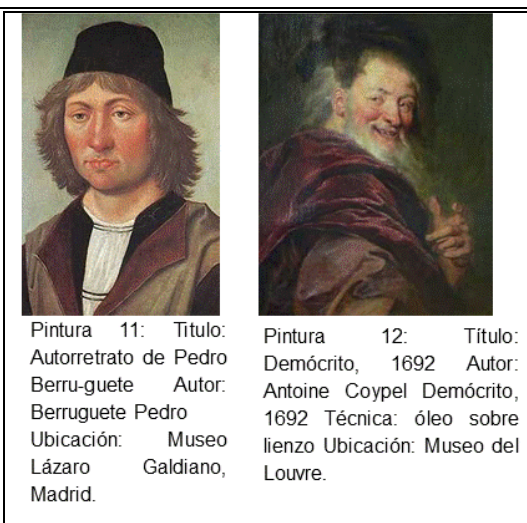
Pintura 11: Título: Autorretrato de Pedro Berruguete Autor: Pedro Berruguete Ubicación: Museo Lázaro Galdiano, Madrid.

El xantelasma es un levantamiento graso situado en o alrededor de los párpados, o en otras áreas de la piel, son llamados xantomas. Son frecuentes en personas con trastornos hipercolesterolemia y diabetes mellitus. 7