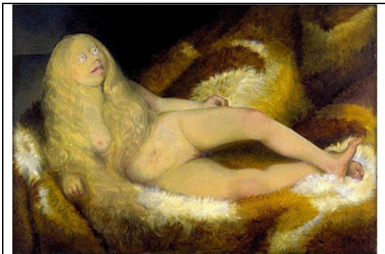
Pintura 8: "Menina nua", 1932 Autor: Dix, Otto (1932) Técnica: óleo sobre tela Se ilustró una joven con un aspecto fenotípico sugestivo de esta condición.

En otra mirada, esta lesión hipercrómica puede recordar el nevus epidérmico; una anomalía en el desarrollo de la epidermis, que se manifiesta como una lesión verrugosa de la piel, única o múltiple, de entre 1 y 4 centímetros, que en el 60% de los casos está presente en el momento del nacimiento y tiende a crecer lentamente hasta alcanzar su máximo tamaño en la adolescencia. También hace pensar en un nevo melanocítico adquirido común o nevo adquirido típico; en general, su aspecto es regular, la superficie y coloración homogénea, de forma redondeada u oval, y bordes bien delimitados y uniformes. Pueden ser lesiones planas, ligeramente elevadas, papilomatosas, en cúpula o pedunculadas. 7