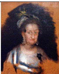
Pintura 6: Título: Infanta Doña María Josefa (1800-1). Autor: Francisco Goya. Técnica: Óleo sobre lienzo Estilo: Neoclasicismo

sugestiva de queratosis seborreica, o lentigo