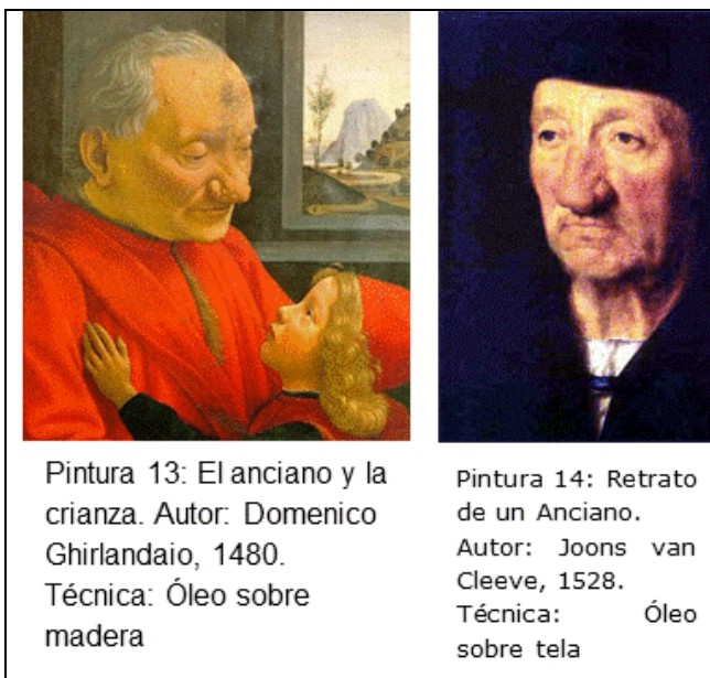
Pintura 13: El anciano y la crianza. Autor: Domenico Ghirlandaio, 1480. Técnica: Óleo sobre madera