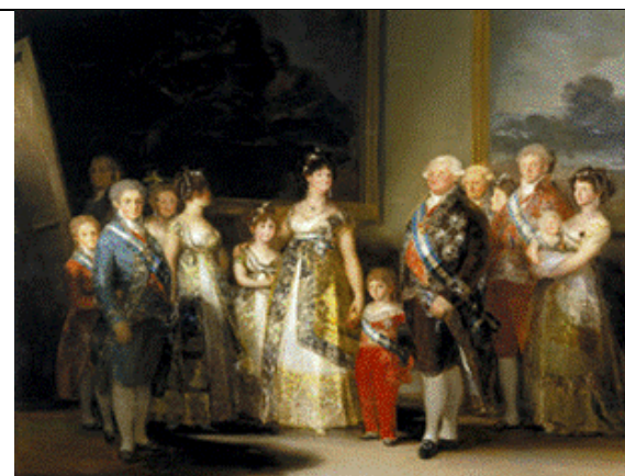
Pintura 5: Título: La familia de Carlos IV (1800-

En la obra de Francisco Goya y Lucientes "Familia de Carlos IV" 12, 13 (pintura 5), María Josefa de Borbón, la cuarta figura que aparece de izquierda a derecha, presenta en la sien derecha una mancha negra sugestiva de queratosis seborreica, o lentigo (lesiones planas, de color pardo, con pigmentación uniforme) o de un parche terapéutico utilizado en el siglo XIX contra la cefalea. También se podría remedar un melanona; o representar un artefacto, pero este elemento pictórico aparece también en un boceto producido por Goya en su obra: "Infanta Doña María Josefa" (pintura 6), lo que hace probable que la modelo presentara una lesión dermatológica: mancha