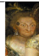
1). Autor: Francisco Goya y Lucientes. Técnica: Óleo sobre lienzo Estilo: Neoclasicismo

En la obra de Francisco Goya y Lucientes "Familia de Carlos IV" 12, 13 (pintura 5), María Josefa de Borbón, la cuarta figura que aparece de izquierda a derecha, presenta en la sien derecha una mancha negra sugestiva de queratosis seborreica, o lentigo (lesiones planas, de color pardo, con pigmentación uniforme) o de un parche terapéutico utilizado en el siglo XIX contra la cefalea. También se podría remedar un melanona; o representar un artefacto, pero este elemento pictórico aparece también en un boceto producido por Goya en su obra: "Infanta Doña María Josefa" (pintura 6), lo que hace probable que la modelo presentara una lesión dermatológica: mancha