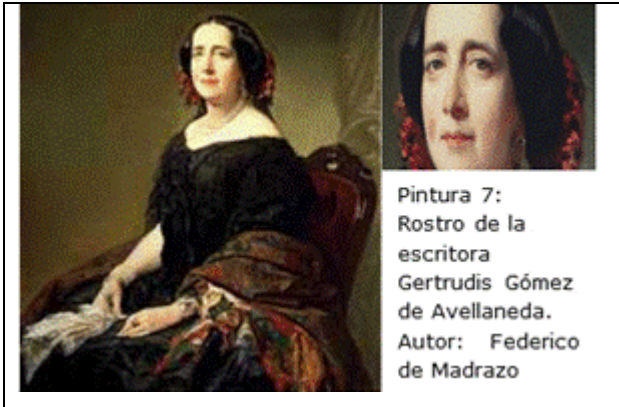
Pintura 7: Rostro de la escritora Gertrudis Gómez de Avellaneda. Autor: Federico de Madrazo

Respecto a la mancha hipercrómica que se observa en la parte derecha del rostro de la escritora Gertrudis Gómez de Avellaneda 14 (pintura 7), se ha planteado que puede expresar una malformación de capilares, por ejemplo un hemangioma o neoplasia de vasos sanguíneos, generalmente benigna, caracterizada por la aparición de muchos vasos normales y anormales en la piel o en