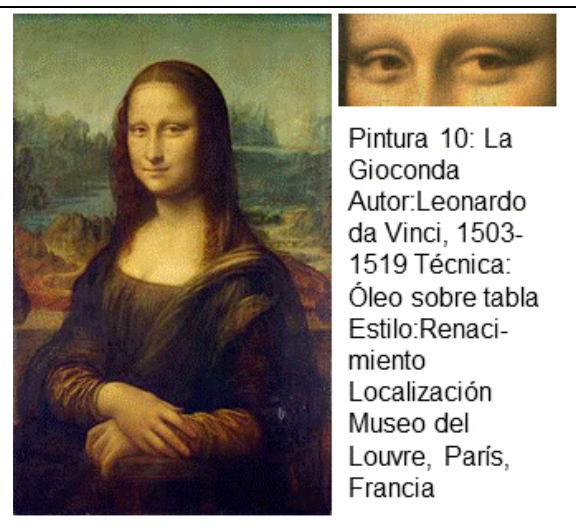
Pintura 10: La Gioconda Autor: Leonardo da Vinci, 1503-1519 Técnica: Óleo sobre tabla Estilo: Renacimiento Localización: Museo del Louvre, París, Francia