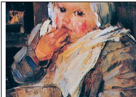
Pintura 4: Título. La escudilla de papa Autor: Alessandro Miesi.

La obra “Cristo en casa de Marta y María”, óleo sobre lienzo del pintor Diego Velázquez (1618) (pintura 3) 10 ilustra una doncella trabajando en la cocina, con una coloración en la mejilla y la mano derecha (piel que recubre el quinto y cuarto artejo), que pudiera ser expresión de una erupción cutánea, tal vez por una dermatitis alérgica o por contacto, conocida como “dermatitis del ama de casa” u ocupacional.