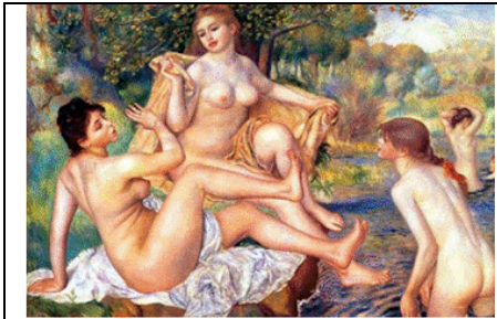
Pintura 2: Título: Las grandes bañistas (Les Grandes Baigneuses) Autor: Pierre-Auguste Renoir, 1884-1887 Técnica: Óleo sobre lienzo Estilo: Impresionismo Localización: Museo de Arte de Filadelfia, Filadelfia, Estados Unidos

cuenta la posibilidad de una dermatitis alérgica, una erupción por medicamentos, o el diagnóstico de las eflorescencias.