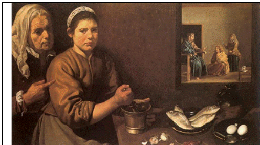
Pintura 3. Título: Cristo en casa de Marta y María Técnica: Óleo sobre lienzo Autor: Diego Velázquez, 1618. Estilo: Barroco Localización: National Gallery, Londres, Reino Unido

(pintura 2) 9 el artista posiblemente ilustró la dermatitis solar.